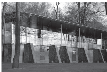
EVS, parc scientifique du Sart Tilman, 1998