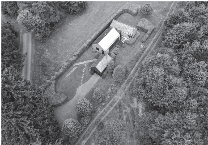
Maison Bisschop, Bütgenbach, 1981, photo: Dethier Architecture

La conception de son premier projet d'architecture, illustré ci-dessous, lui a d'ailleurs été confiée par son père, qui en assurait la construction. Il s'agissait d'un chalet imaginé comme résidence secondaire pour un couple d'Allemands. Dethier établit rapidement une relation entre le bâtiment et l'environnement proche que ce soit pour le choix des matériaux ou dans la forme de l'édifice. Rapidement, les maîtres d'ouvrage se montrent enthousiastes et lui confient même le design de tout le mobilier.