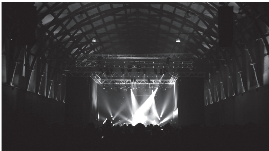
Manège de la Caserne Fonck, Liège, 2009, photos : Serge Brison (haut), Dominique Houcmant (bas)