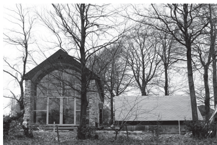
Maison Rosenfeld, Sourbrodt, 1988

Daniel Dethier a créé son approche architecturale en étant inspiré par le Régionalisme Critique. Ce concept affirme qu'un bâtiment devrait s'adapter au lieu où il se trouve. Partant de la constatation que l'architecture moderne utilise souvent les mêmes formes et les mêmes matériaux et cela, peu importe l'endroit, le régionalisme critique veut mélanger le moderne avec les traditions locales. Dès lors, chaque bâtiment aura une identité unique, liée à son histoire, sa culture, son climat, sa géographie, etc.