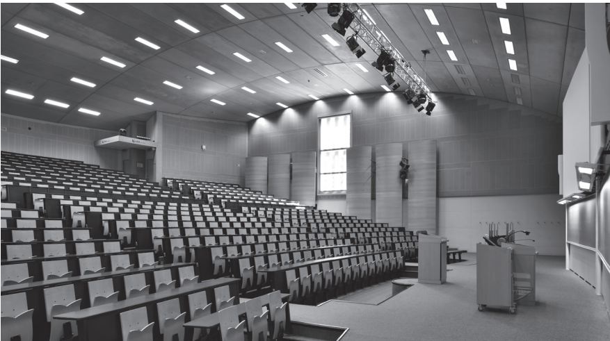
Amphithéâtres de l'Europe, domaine universitaire du Sart Tilman, 1997, photos: Serge Brison