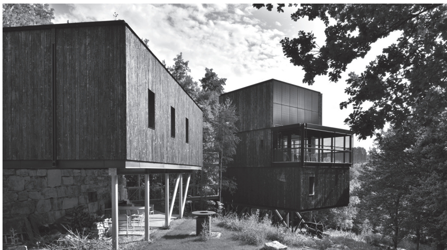
Démonstrateur Hosomi, Outrewarche, 2025, photos: Serge Brison