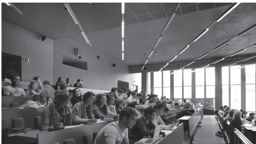
Amphithéâtres Opéra, Liège, 2013